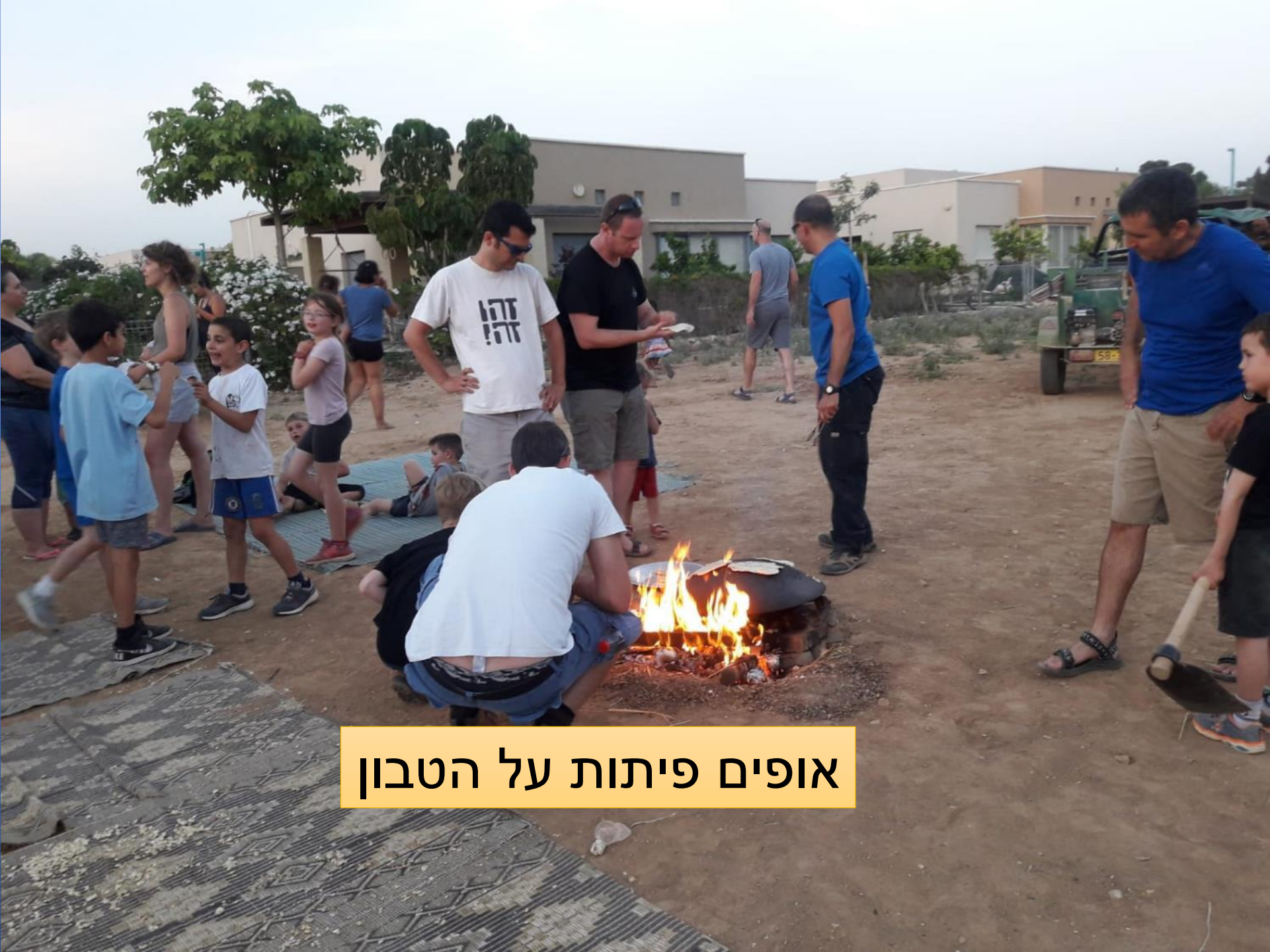
אופים פיתות על הטבון