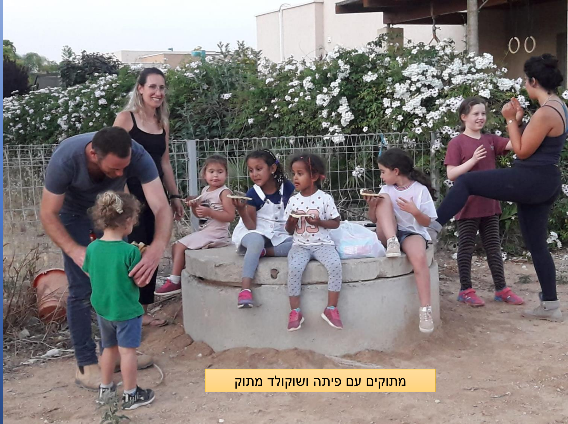
מתוקים עם פיתה ושוקולד מתוק