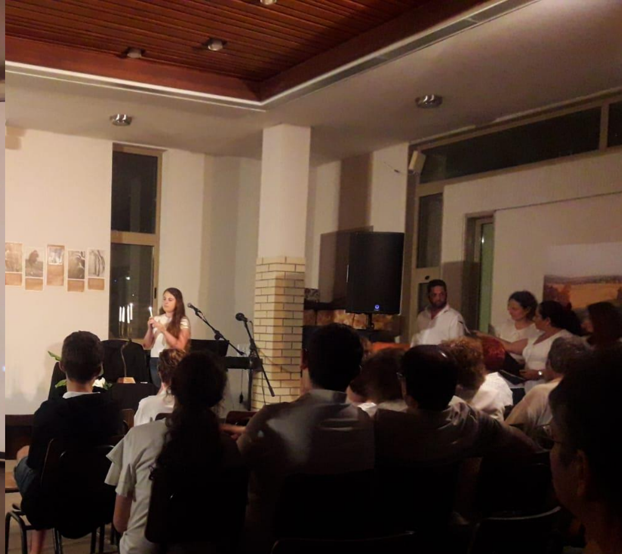
חניכי כתות י"ב, שחזרו השנה מסיור בפולין, מדליקים נרות לזכר קורבנות השואה