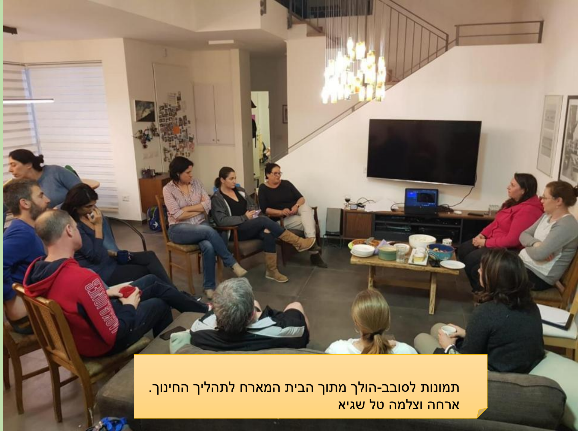
תמונות לסובב-הולך מתוך הבית המארח לתהליך החינוך.