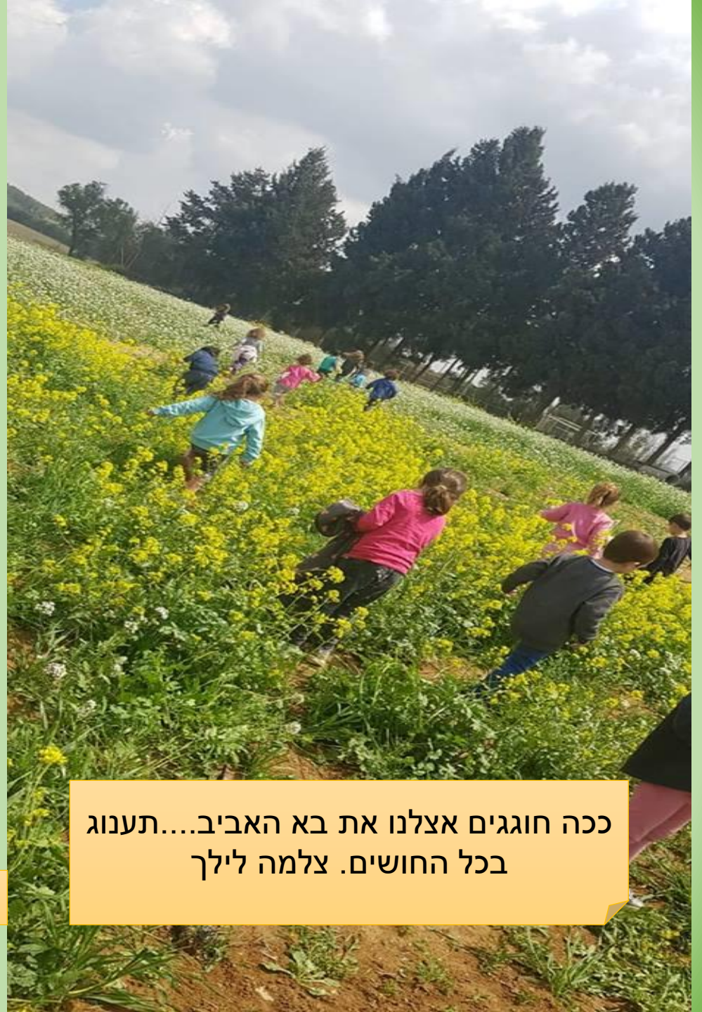
ככה חוגגים אצלנו את בא האביב....תענוג בכל החושים.