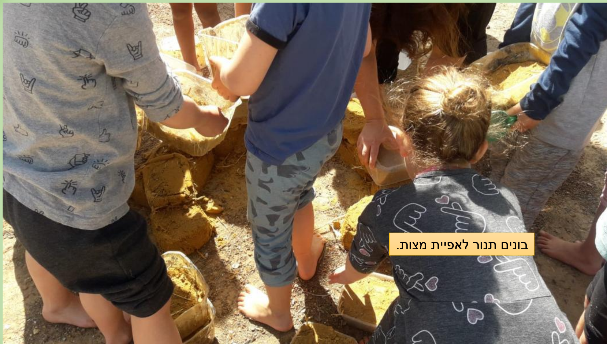
בונים תנור לאפיית מצות.