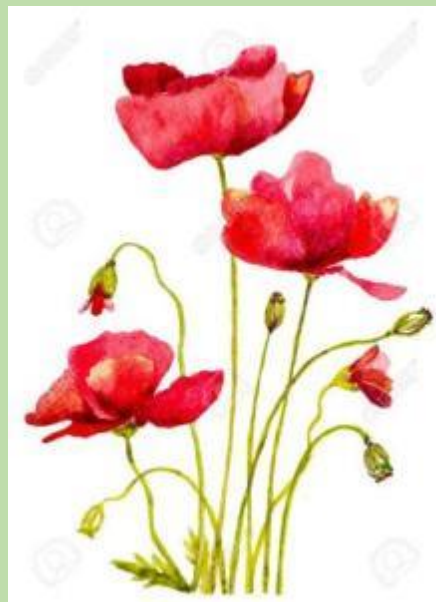
"אביב הגיע , פסח בא"