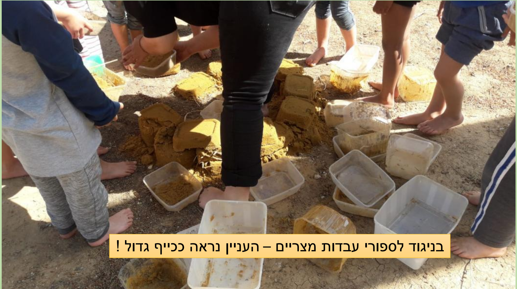
בניגוד לספורי עבודות מצריים – העניין נראה ככייף גדול !