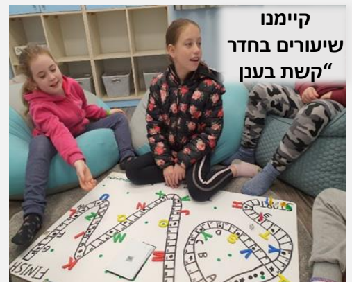
קיימו שיעורים בחדר "קשת בענן"