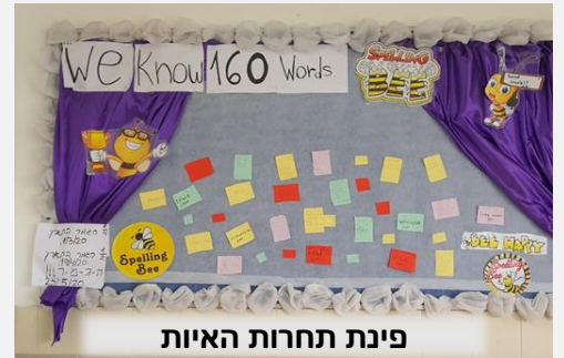
פינת תחרות האיות