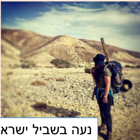
נעה בשביל ישראל