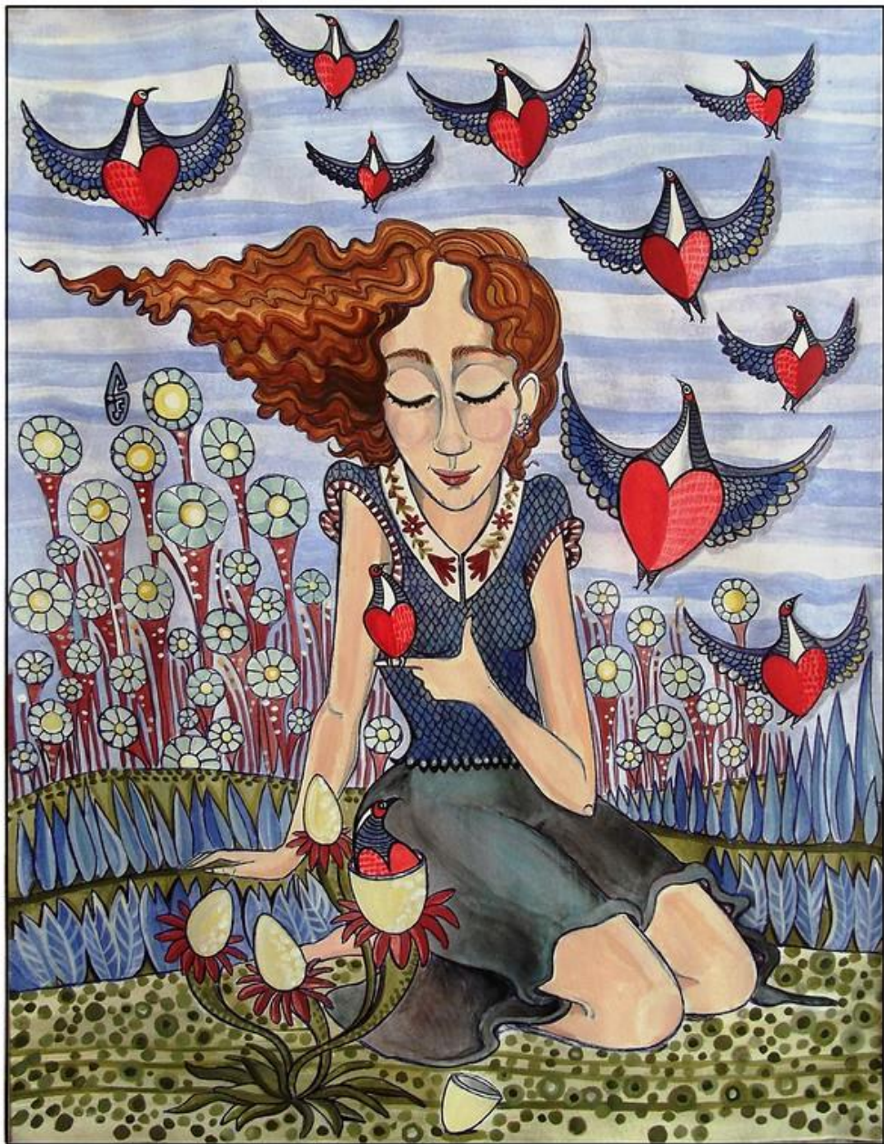
מתוך אוסף ציוריה של שי איפאגן