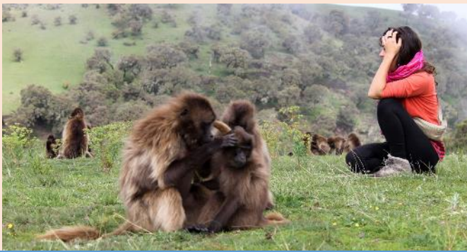
שי באתיופיה עזרה באוניברסיטה לסטודנטים בחקלאות