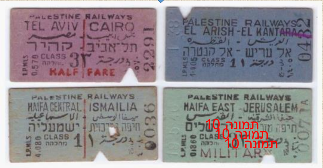
וכרטיסי רכבת העמק. תמונה מס 2