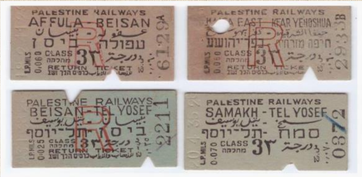
כמו כן אוסף מיוחד של כרטיסי נסיעה של חברות ערביות בתקופת המנדט הבריטי כמובן.