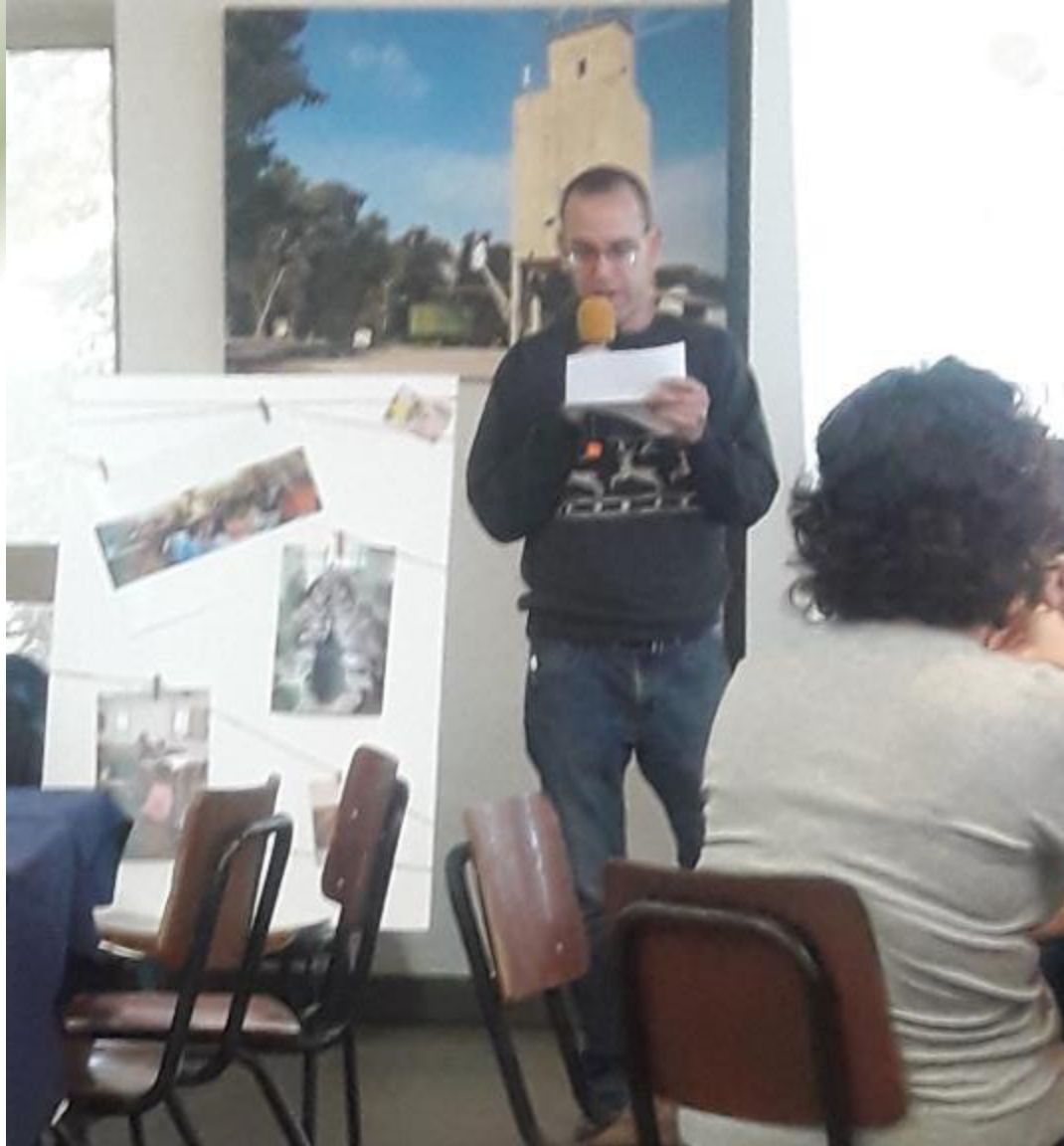
בני, פותח בנימה (קצת) אישית.