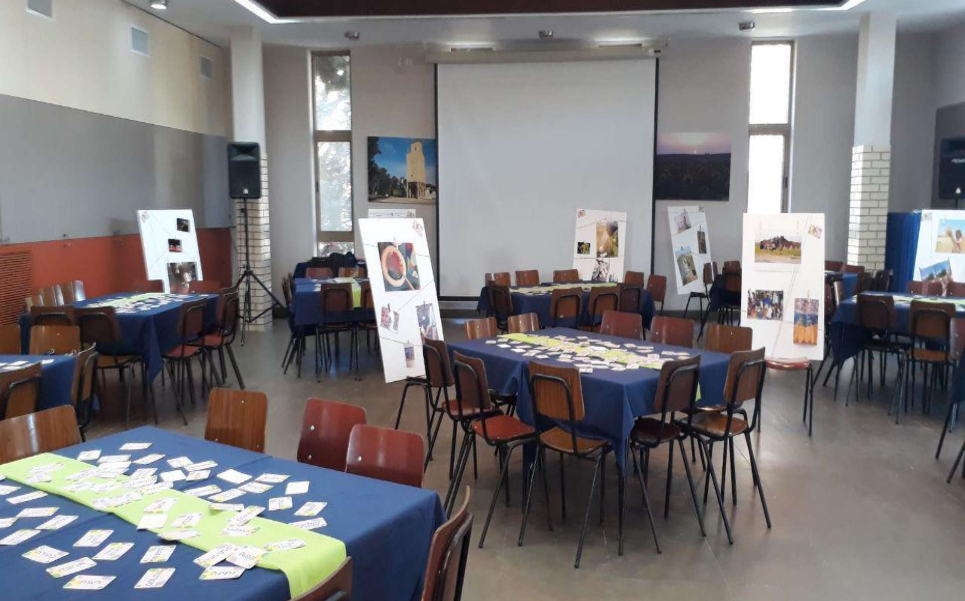
האולם ערוך לקראת המפגש