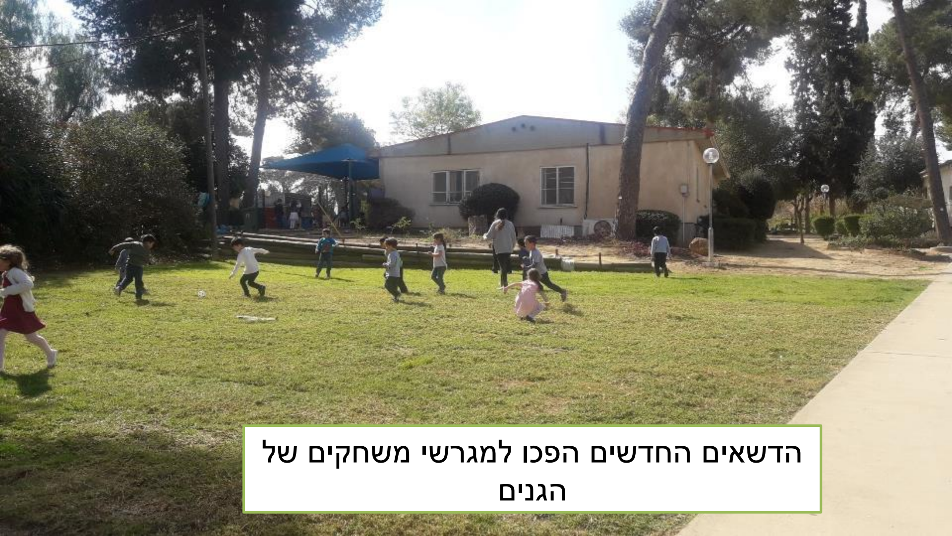
הדשאים החדשים הפכו למגרשי משחקים של הגנים