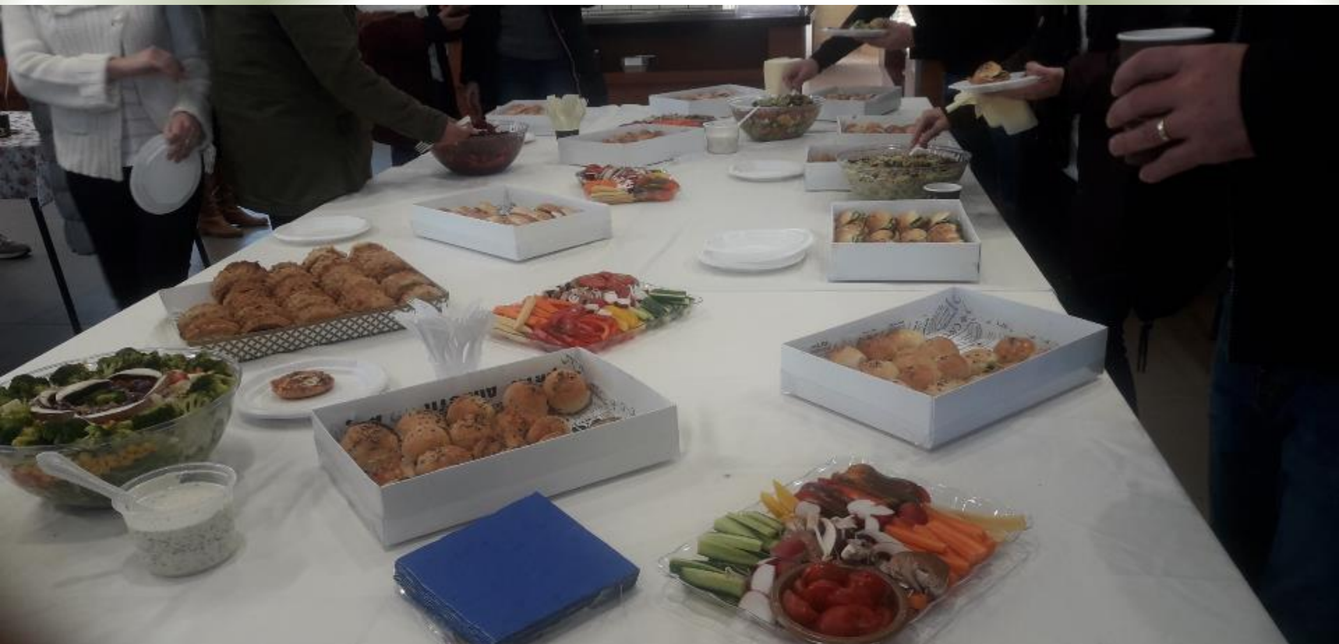
וגם, ארוחת בוקר מושקעת