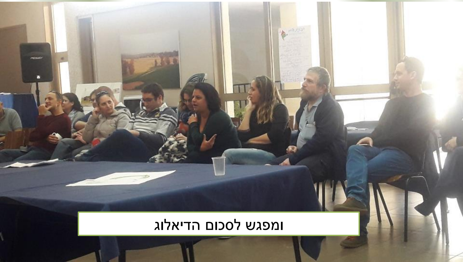
ומפגש לסכום הדיאלוג