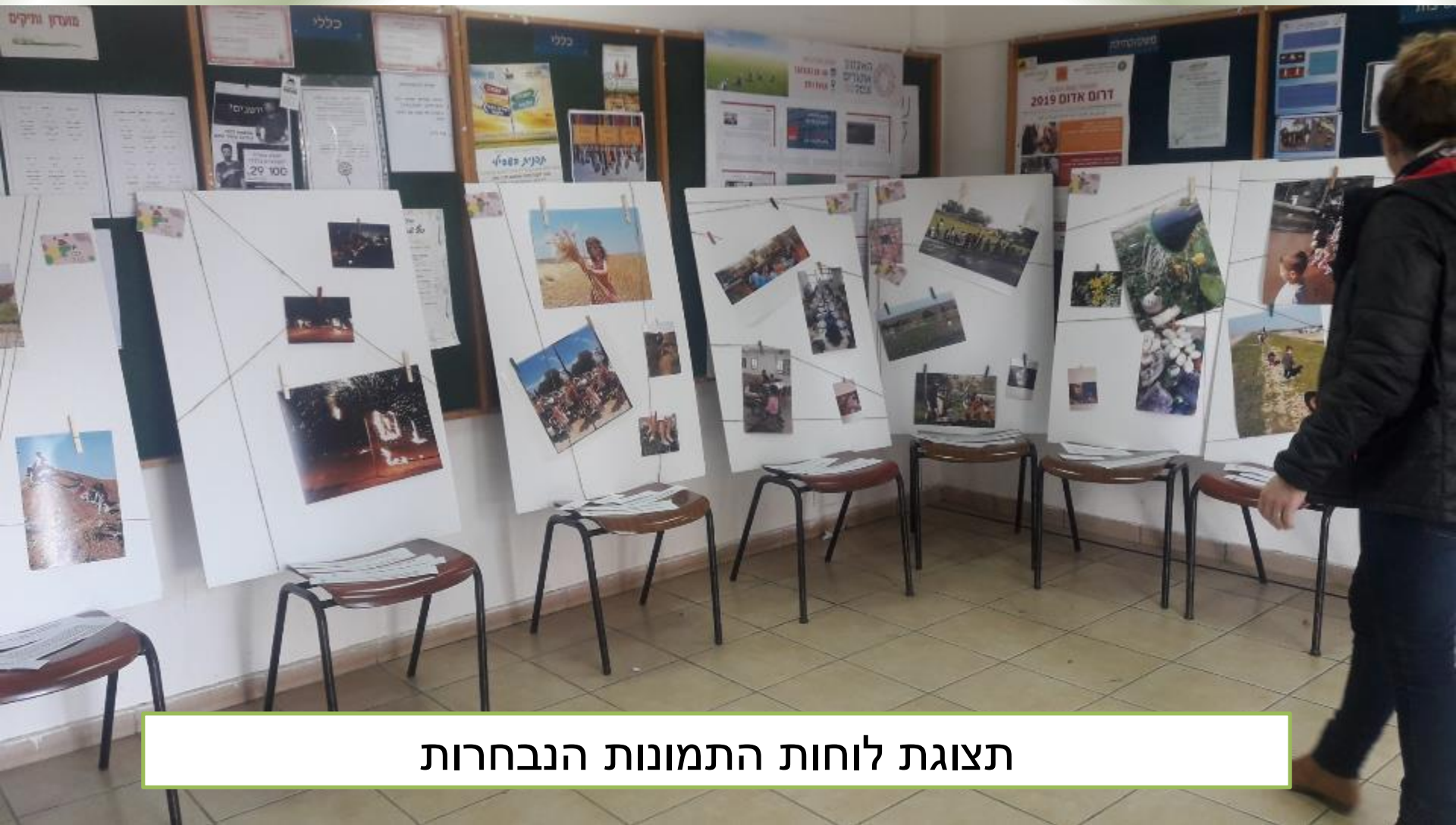
תצוגת לוחות התמונות הנבחרות